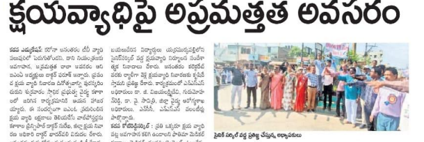
వైద్య కార్యకర్తల వద్ద ప్రతి వ్యక్తి చికిత్స, అధ్యాపకులు