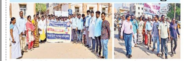
వేంపల్లిలో ర్యాలీలో పాల్గొన్న చైర్మనులు, సీబి, విద్యార్థులు... కడప నగరంలో అధ్యాపకులు, విద్యార్థులు