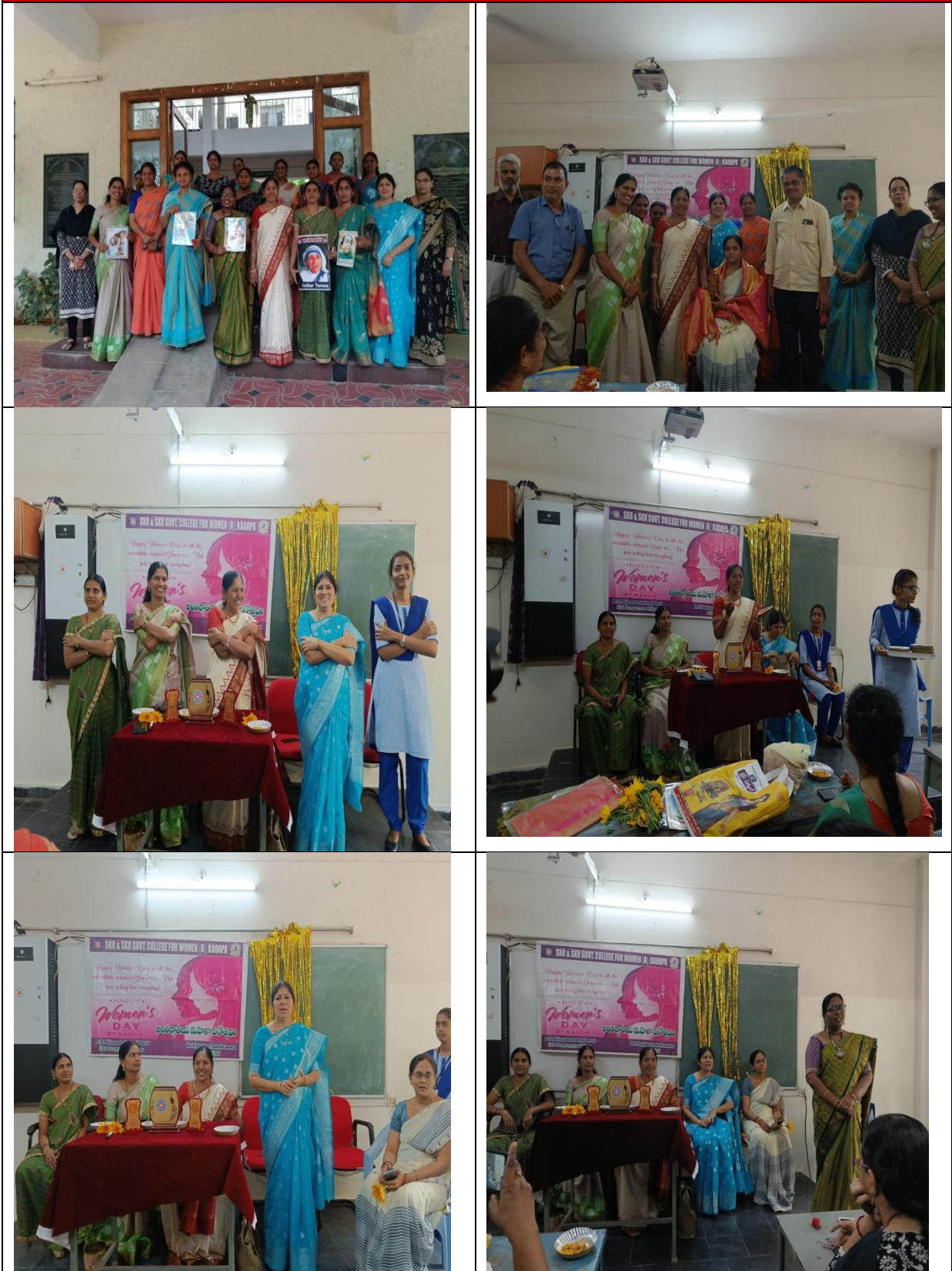
SKR & SKR Govt. College for Women (A), Kadapa.